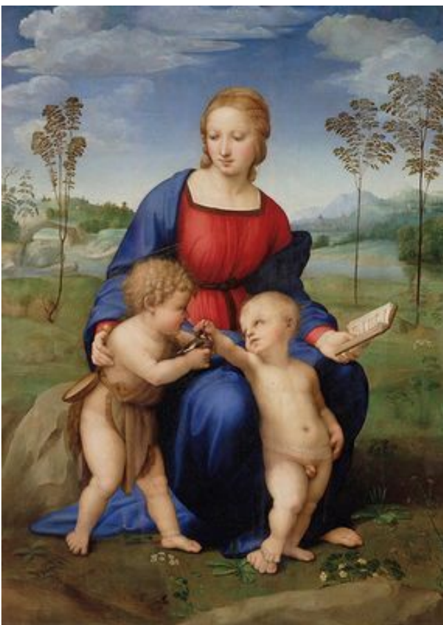
Raffaello «Madonna del cardellino»

Quegli uomini divini appartengono ancora a un'epoca artistica, in cui la creatività dello Spirito operava, in grandissima parte, all'insaputa dell'artista stesso, non ancora orientata del tutto dal di dentro di lui. Non era ancora effettuato interamente il trapasso verso la coscienza singola,