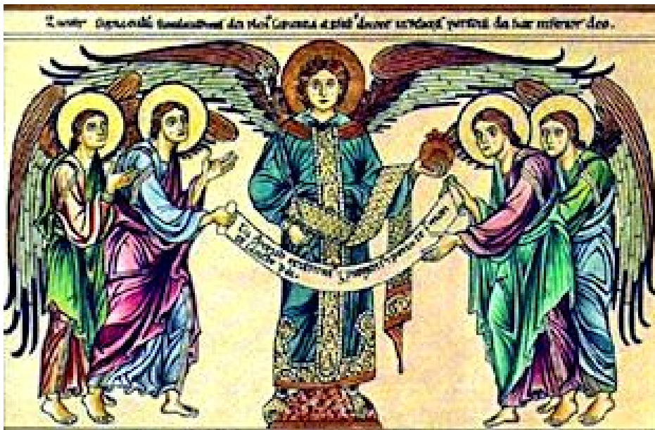
«Lucifero portatore di Luce» dal codice Hortus Deliciarum

Servirà, per comprendere altri nessi, rileggere le parole di Steiner relative alla necessità di riempire di nuova saggezza il proprio corpo eterico che, attualmente, si avvia a riuscire dal corpo fisico: «Se però il corpo eterico, quando comincerà a staccarsi dal fisico, verrà a trovarsi in un elemento sbagliato, troverà le forze capaci di agire a loro volta in modo vivificante su quanto è in esso penetrato come principio-Cristo, allora il corpo eterico in via di progressiva liberazione possiederà sí le forze del Cristo, ma penetrerà in un elemento nel quale non può vivere. Le forze esterne lo distruggerebbero: proprio perché è compenetrato dal Cristo, trovandosi in un elemento inadatto esso andrebbe incontro alla distruzione e a sua volta riuscirebbe distruttivo per il corpo fisico. Qual è dunque questo secondo fattore necessario? È la capacità del corpo eterico di ricevere nuovamente la luce dal regno di Lucifero. ...Lucifero, che