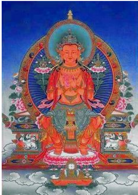
Il Bodhisattva Maitreya

Forse ora ci verrà perdonato quanto, in queste nostre riflessioni, può essere apparso quasi un divagare; adesso possiamo riunire entro una ideale cornice i vari elementi, schizzandone rapidamente un quadro sintetico: