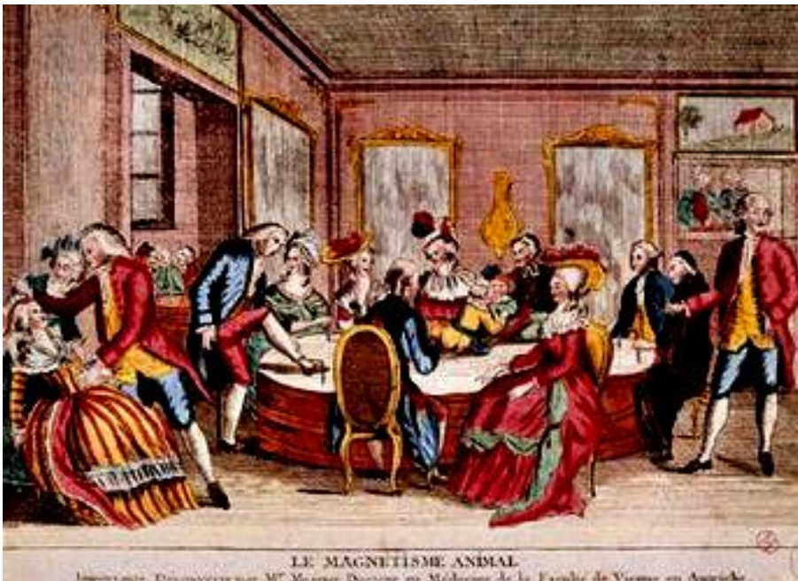
Incisione francese del 1784 che rappresenta una dimostrazione pubblica del “magnetismo animale” di Mesmer, eseguita nel generale disinteresse

coordinare con la ragione. E comprenderete che la scienza ufficiale, che si trovava più o meno sotto l'influenza del pensiero materialistico, si irritasse davanti a queste cose che non si potevano capire. Le guarigioni di Mesmer divennero uno scandalo pubblico. Si diceva: non deve trattarsi di vere malattie, ma solo di malattie immaginarie, così che gli isterici sono guariti solo nell'immaginazione, o che i malati sono liberati dai loro dolori solo nella fantasia. In ogni modo si rifiutava il metodo di Mesmer. La conseguenza fu che per incarico del re furono chiamate due commissioni a giudicare Mesmer. Ve ne parlo proprio perché vediate quale fosse l'atteggiamento della scienza di fronte a queste cose, perché vediate