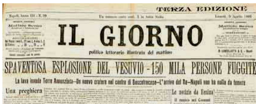
Eruzione del Vesuvio dell'aprile 1906

del nostro pianeta terrestre. In effetti, questi misteri fanno parte di quelli che si chiamano i misteri interni, e che sono riservati a un livello superiore, il secondo grado dell'Iniziazione. In pubblico, non si parla assolutamente mai dell'interno della Terra, come del resto non se ne parla nemmeno in seno al movimento scientifico-spirituale.